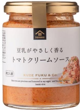
豆乳がやさしく香る トマトクリームソース 734 円⇒580 円（税込）