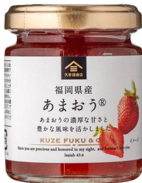
福岡県産 あまおう® 625 円⇒500 円（税込）