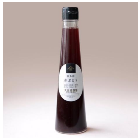
飲む酢 赤ぶどう 614 円⇒500 円（税込）