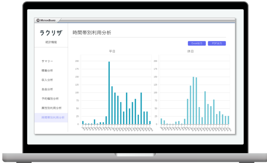
施設管理者向け機能：powered by MotionBoard