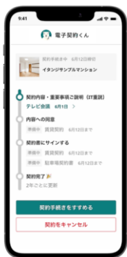
「電子契約くん」入居者 利用画面イメージ

「電子契約くん ( https://lp.itandibb.com/denshi-keiyaku/ )」は、不動産の賃貸借契約や、更新契約、駐車場契約をオンラインで完結できるシステムです。賃貸借契約に関しては対面での重要事項説明が不要で、完全にオンライン上で行います。※重要事項説明はビデオ会議ツールを用い、リアルタイムで実施します。