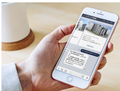
「ノマドクラウド」入居者利用イメージ

物件確認電話の自動応答システム「ぶっかくん」 賃貸住宅の内見予約WEB受付システム「内見予約くん」 不動産関連WEB申込受付システム「申込受付くん」 不動産関連電子契約システム「電子契約くん」 賃貸住宅のWEB更新・退去システム「更新退去くん」 不動産関連業務の自動化システム「RPAくん」 顧客管理・自動物件提案システム「ノマドクラウド」等