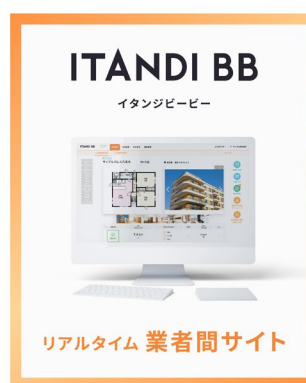
「ITANDI BB +」サービス展開イメージ