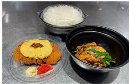
シンプルが一番「定食盛り」