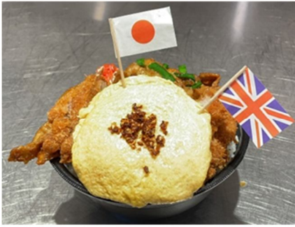
写真映えを狙って「応援メダル盛り」

盛り付け方はお客様の自由！是非、自分だけのオリジナルの盛り付けに挑戦してみてください。