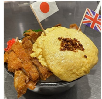
角度が大事！「横顔美人盛り」