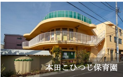
本田こひつじ保育園