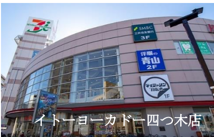
イトーヨーカドー四つ木店