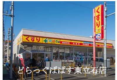
どらっぐぱぱす東立石店