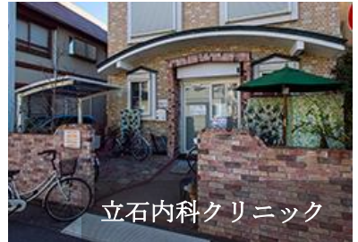
立石内科クリニック