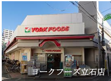
ヨークフーズ立石店