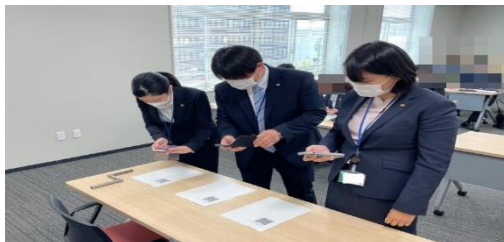
宣誓書の電子提出に取り組む新入職員

【効果】 市職員の手続きにもLoGo フォーム電子申請を活用できることがわかり、署名が必要な手続きのペーパーレス化推進に寄与できます。新入職員にデジタル手続きをいち早く体感してもらうことで、スマート市役所の取り組みを意識付ける機会となりました。