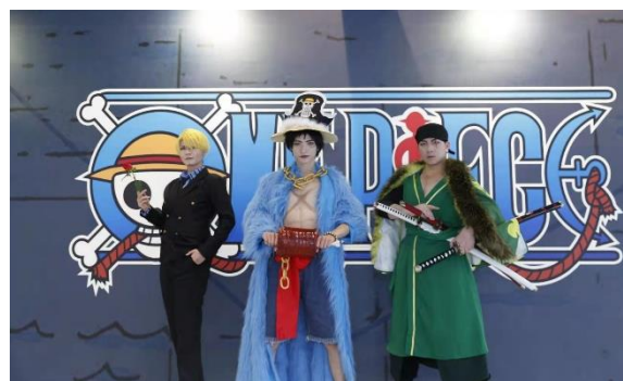
コスプレ大会の様子

日本アニメ「ワンピース」は世界中で、年齢に関係なく幅広い世代に愛され続けている人気漫画・アニメであり、この度、4月24日から約2ヶ月に渡り、寧波阪急の開業式典イベントとして「ワンピース」に関連した様々なイベントを開催しました。開業式典イベントとしては、「ワンピース」に登場する「海賊船サウザンドサニー号」などやキャラクター立像の展示や、スタンプラリーなどが行われ、イベント期間中多くの参加者で賑わいました。また同期間中には、コスプレ大会や主人公ルフィの生誕祭、さらに、中国において大切な人に想いを伝える日として多くの人々が婚姻届を提出するという風習がある「I love you の日」にちなんだイベントも開催し、百貨店内にも人々が気軽に想いを伝えられるブースを設けました。