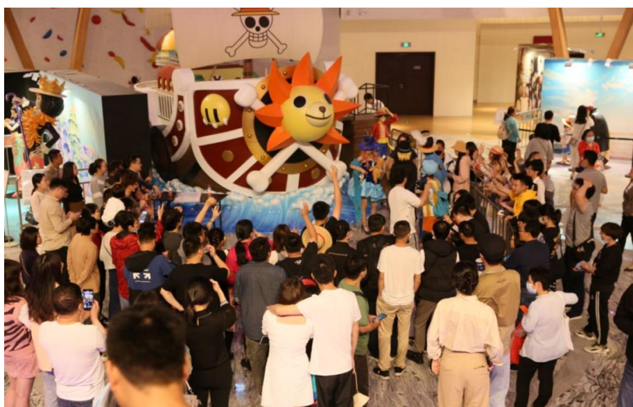
「I love you」の日のイベントの様子

日本アニメ「ワンピース」は世界中で、年齢に関係なく幅広い世代に愛され続けている人気漫画・アニメであり、この度、4月24日から約2ヶ月に渡り、寧波阪急の開業式典イベントとして「ワンピース」に関連した様々なイベントを開催しました。開業式典イベントとしては、「ワンピース」に登場する「海賊船サウザンドサニー号」などやキャラクター立像の展示や、スタンプラリーなどが行われ、イベント期間中多くの参加者で賑わいました。また同期間中には、コスプレ大会や主人公ルフィの生誕祭、さらに、中国において大切な人に想いを伝える日として多くの人々が婚姻届を提出するという風習がある「I love you の日」にちなんだイベントも開催し、百貨店内にも人々が気軽に想いを伝えられるブースを設けました。