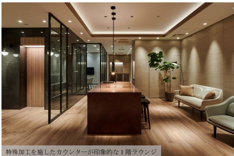
特殊加工を施したカウンターが印象的な1階ラウンジ