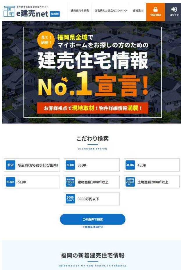
e 建売 net トップページ

お客様は、サイト内で物件の検索した後、希望物件の内見予約をすることができ、当社が物件の案内から売主との交渉、売買契約手続き、物件引渡しまで、ワンストップでお客様のサポートを行う。