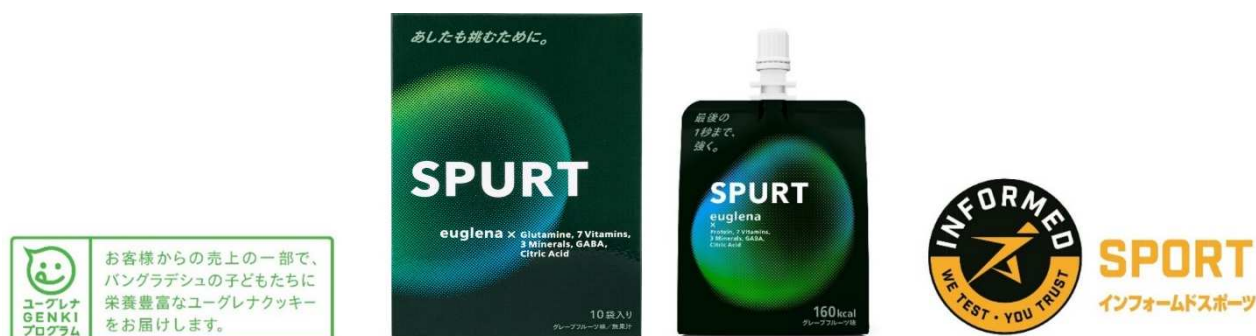
左から：「ユーグレナ GENKI プログラム」ロゴ、SPURT 商品イメージ、「インフォームド・スポーツ」ロゴ

Instagram : https://www.instagram.com/euglena_spurt/?hl=ja