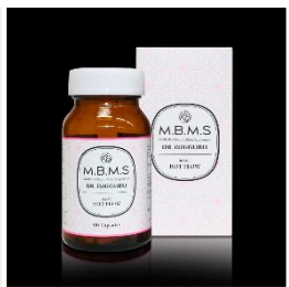
健康食品及びサプリメント