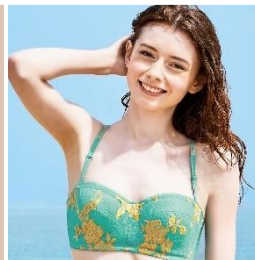
デコルテ リュミエス シリーズ