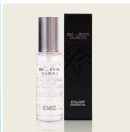
me_more MARUKO シリーズ