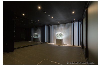
コンペの最優秀作品は実際にマンションのエントランスホールに設置