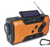
照明付防災ラジオや簡易トイレを防災倉庫に常備 (停電時の備品対策)