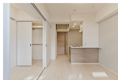
アンケート結果に基づき、収納スペースの拡大を実現した居住スペース