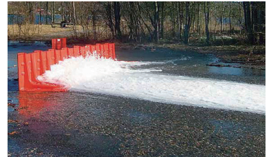
ハザードマップにより簡易止水板の設置 (共用部の雨水侵入対策の強化)