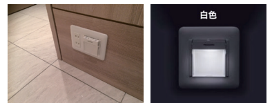
停電時にも点灯する保安灯を常備