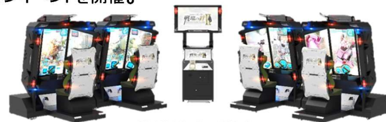
『機動戦士ガンダム 戦場の絆II』 機種通・サンライズ