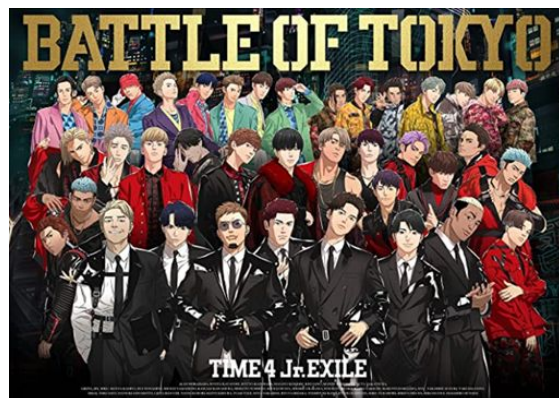
GENERATIONS, THE RAMPAGE, FANTASTICS, BALLISTIK BOYZ from EXILE TRIBE