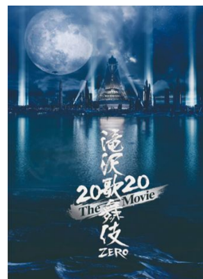
Snow Man主演映画 「滝沢歌舞伎 ZERO 2020 The Movie」