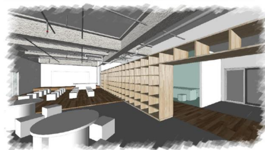
施設レイアウトイメージ