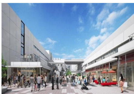
羽田イノベーションシティ（HICity）

当社グループは、新たなビジネス・サービスを創出する能力と課題解決力をご提供し、お客さまからの信頼や満足度を高めるとともに、お客さまの新しい価値を創造する“東京発プラットフォーム”（※1）を目指すことで、地域社会の持続的成長への貢献等、ステークホルダーの皆さまのご期待に応えてまいります。