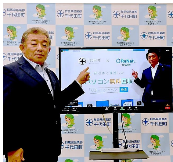
群馬県千代田町との協定締結式

リネットジャパンは、宅配便を活用したパソコン・小型家電のリサイクルを通じて、限りある資源の有効活用を促進し、一層の環境・社会への貢献を目指して参ります。