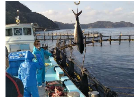
水揚げされている様子