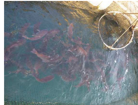
真鯛を引き揚げる様子