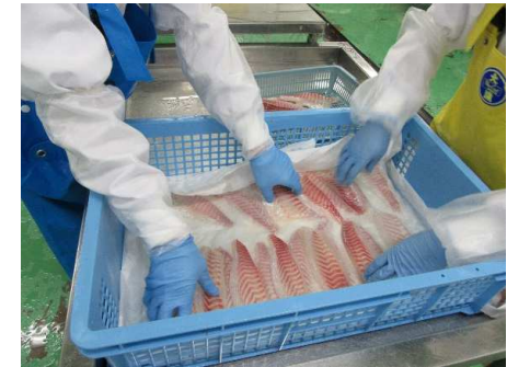
国際的に認められた高衛生環境で加工