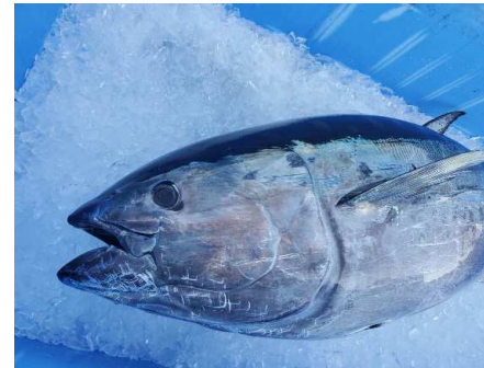
「近大生まれマグロ」

宅配寿司「銀のさら」において、水産資源の保護活動支援を目的に、完全養殖技術の研究により水産資源の増産に寄与している「近畿大学水産研究所（以下、近大）」とのコラボレーション企画として、期間限定で、「近大生まれマグロ」と「近大生まれ鮮熟（せんじゅく）真鯛」を使った商品を販売いたしました。