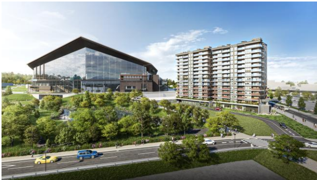
外観完成予想図 (俯瞰図)

*マンションご購入者には、特典としてお引渡しから 10 年間ご利用いただける球場へのフリーパスを付与する予定です。