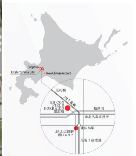
F ビレッジおよび JR 北広島駅位置図