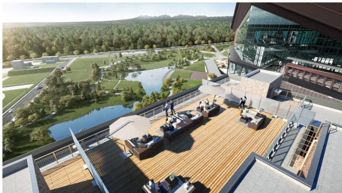
共用テラス完成予想図

*1 階には、自然素材を使って仕上げ、暖炉を囲みながらくつろげる「ウォームリビング」のほか、リモートワークとして活用できる「コワーキングスペース」など、あらゆる世代の方にお使いいただける多彩な共用空間をご提供いたします。