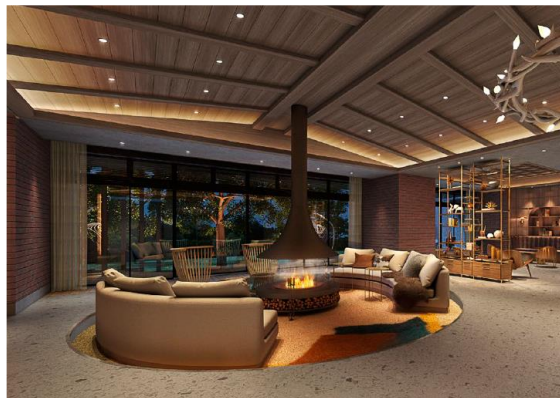
ウォームリビング完成予想図