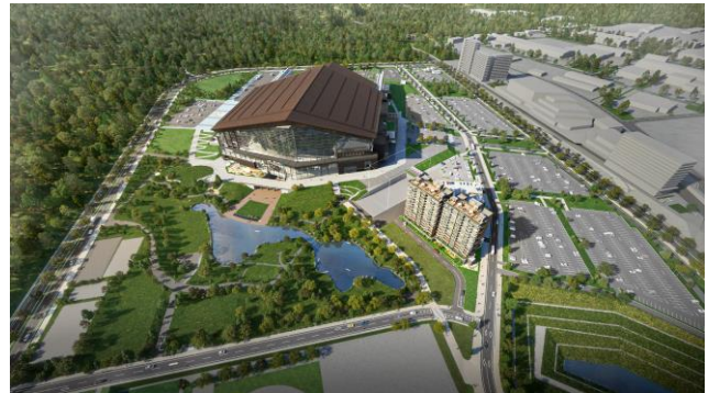
F ビレッジ エリア全体完成イメージ図