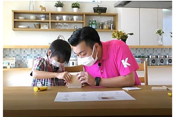
(勝美住宅社員とお子様による工作の様子を2台のカメラで撮影)