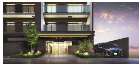
エントランスアプローチ完成予想図