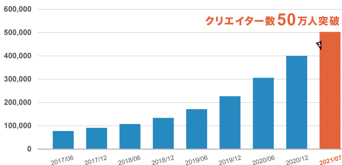
SUZURI クリエイター数推移

オリジナルグッズ作成・販売サービス「SUZURI byGMO ペパボ」は、2014年4月のサービス開始以来順調に登録クリエイター数が伸びております。特に2020年以降の伸びは顕著で、新型コロナウイルス感染拡大の影響により、気軽にEC事業をスタートできる「SUZURI byGMO ペパボ」を選択するクリエイターも増加したことなどを背景に、2021年7月29日（木）に50万人を突破しました。