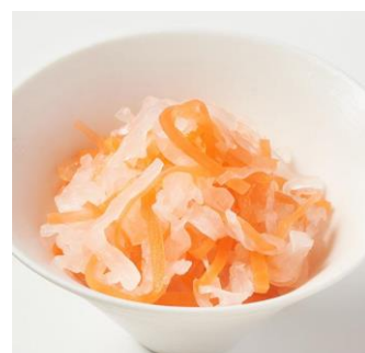
紅白なます： お酢の量を調整しより食べやすく

【商品概要】 ※価格は購入時期によって異なります。詳細は販売ページをご覧ください。