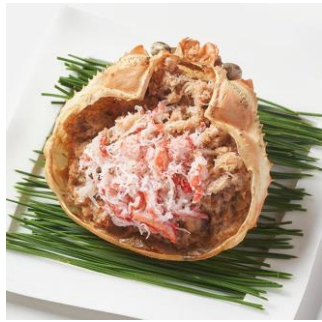
蟹甲羅盛： 蟹みそを混ぜこみ濃厚な旨み