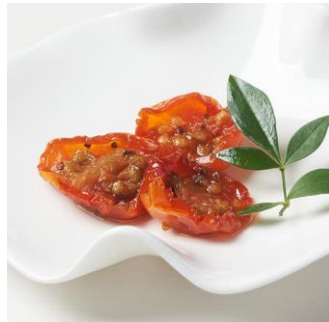
チェリートマトのハーブオイル漬： 酸味のある品種を選び旨みを凝縮