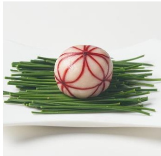
粒餡華手まり： 華やかさとモチモチ感がアップ