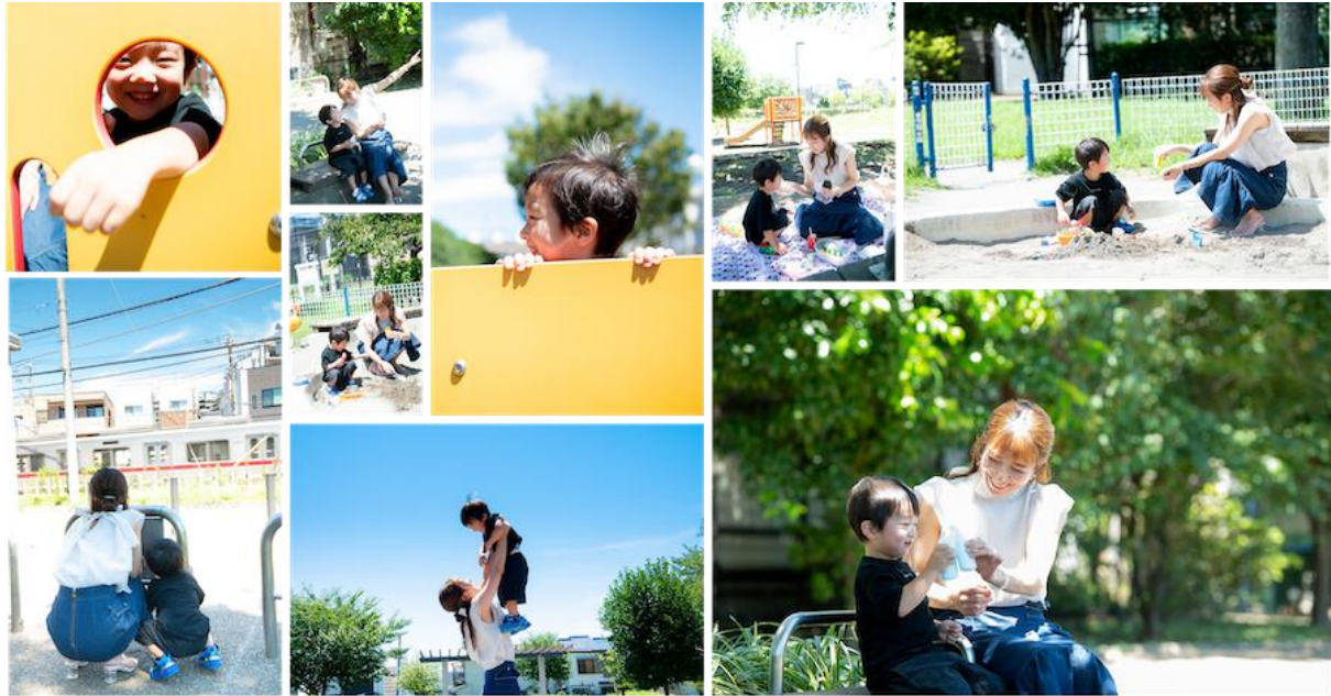
※撮影時のみ周囲に人がいないことを確認した上でマスクを外しています

幸空との記念撮影はずっとやりたいたって思っていました。時期も時期なので先延ばしにしていたのですが、幸空の成長があまりにも早すぎて、「今は今しかない」ので幸空と私の自然な写真を写真に収めたいと思っていたのです。今までも自分たちで自撮りしたり、カメラに向かって顔やポーズを決めた写真は撮ってきましたが、客観的な目線でみる自然体の「親子の姿」の写真はありませんでした。そういう客観的な私たちの写真があったらいいなと思っていたところ、fotowa さんからご縁をいただき、素敵な思い出をつくることができました。