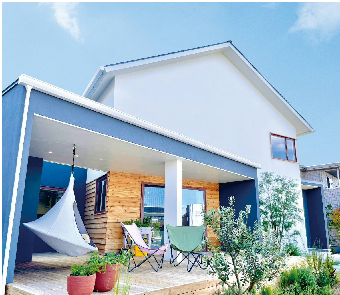
モデルハウス外観