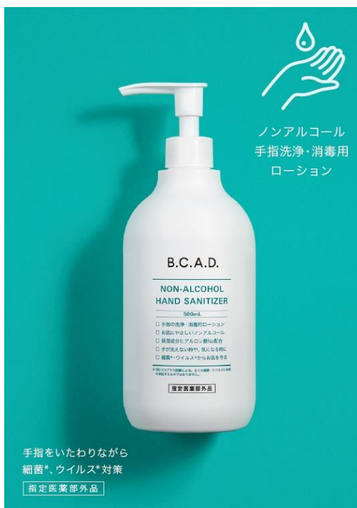
「B.C.A.D.ノンアルコールハンドサニタイザー」商品イメージ

※2 医薬品、医療機器等の品質、有効性及び安全性の確保等に関する法律(薬機法)に基づき「指定医薬部外品」として承認されています