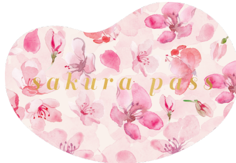
Sakura Pass カード