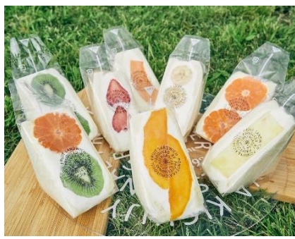
㊤先手家・ユナイテッドネイチャー

＜青果・フルーツサンド・食品＞ココーン2・1階 八百屋の手作りフルーツサンドや、旬・味・品質に 拘った食品を豊富に。