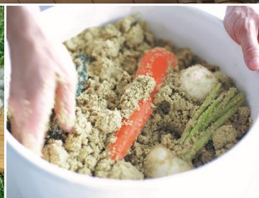
写真 左下：久世福商店 中央下：@先手家・ユナイテッドネイチャー 右下：85 [ハチゴウ]

※新型コロナウイルス感染拡大防止のため、施設内の入場を制限させていただく場合がございます。ご来館の際は、混雑時間を避けてのご利用と、マスク着用やソーシャルディスタンス等、感染拡大防止策へのご理解・ご協力をお願い申し上げます。