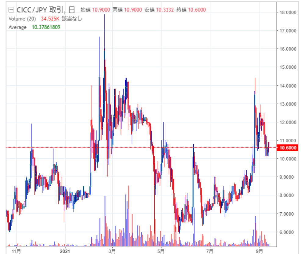
Zaif Exchange Orderbook tradingのチャート