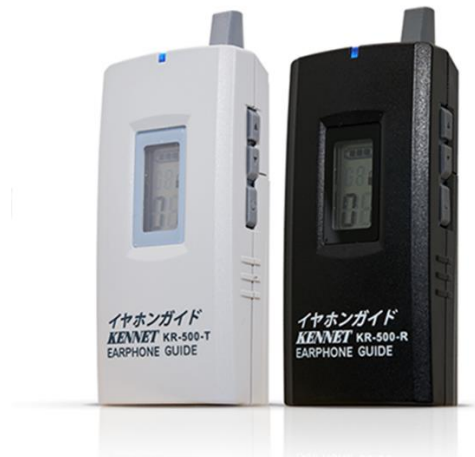
▲イヤホンガイド KR-500（左）送信機（右）受信機