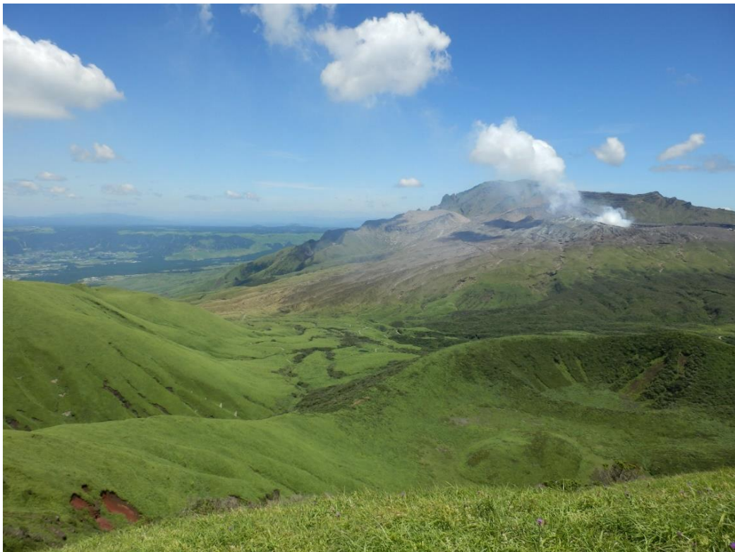
▲阿蘇くじゅう国立公園（中岳火口を望む）

当社グループの株式会社ケンネットが製造・販売するガイドレシーバー「イヤホンガイド®」が、「阿蘇くじゅう国立公園」において採用されたことをお知らせいたします。