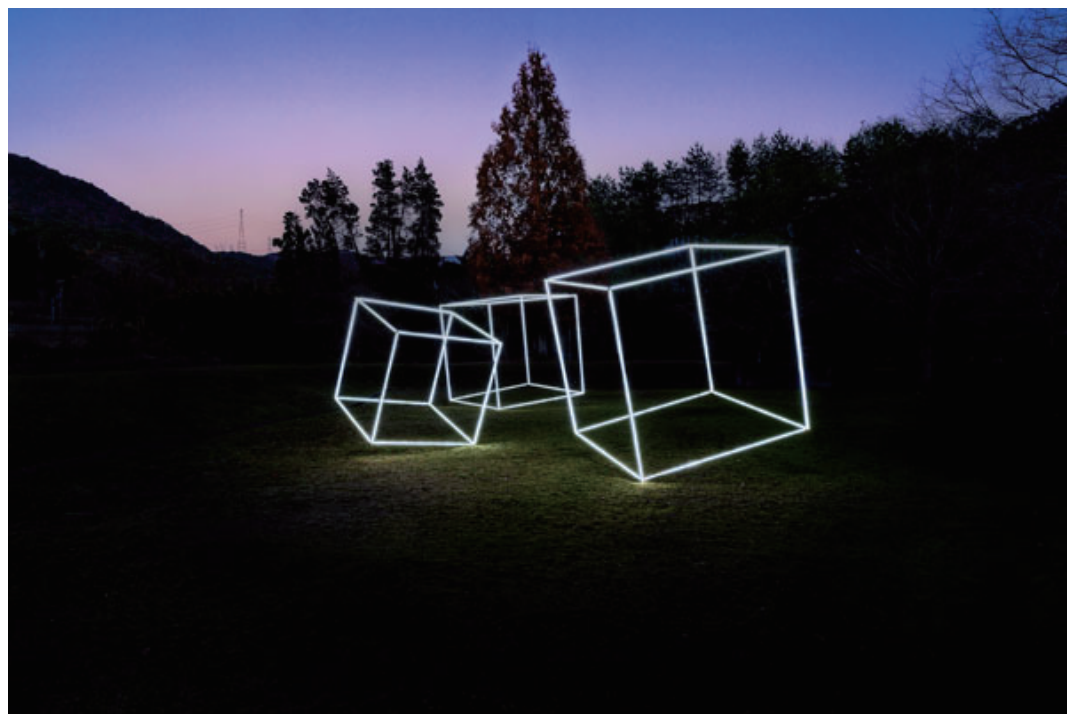
「のせでんアートライン2021 メインビジュアル」