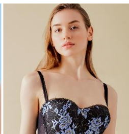
デコルテ リュミエス シリーズ