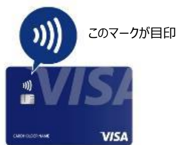
〔対応カードの一例〕

バス車載運賃箱に、Visa のタッチ決済の読取機器を設置します。Visa のタッチ決済に対応したカード（クレジット、プリペイド、デビット）をかざしていただくことで運賃をお支払いいただけます。大人運賃及び小児運賃に対応しています。