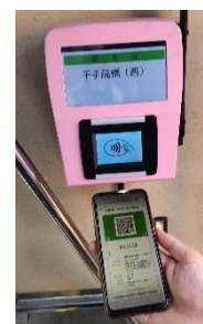
南海りんかんバス 利用イメージ