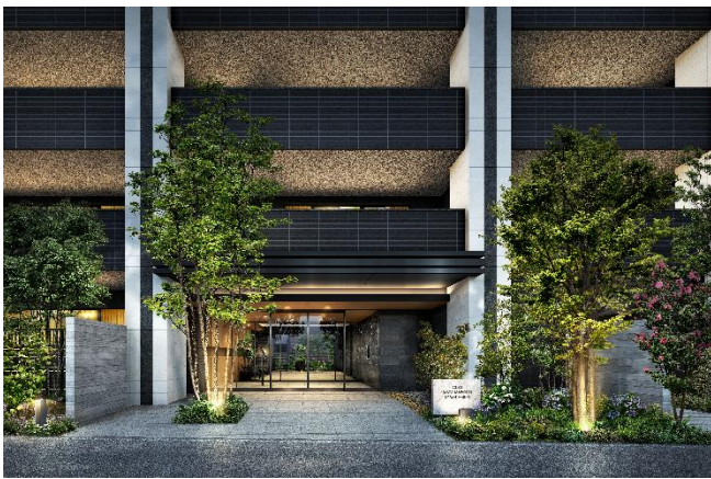
エントランス完成予想図（※2）