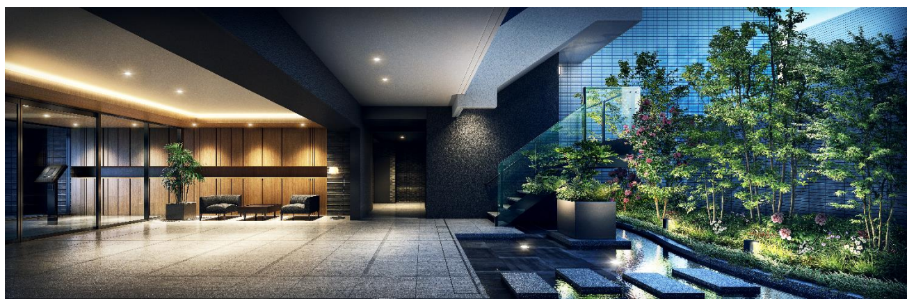
エントランスホール完成予想図 (※2)