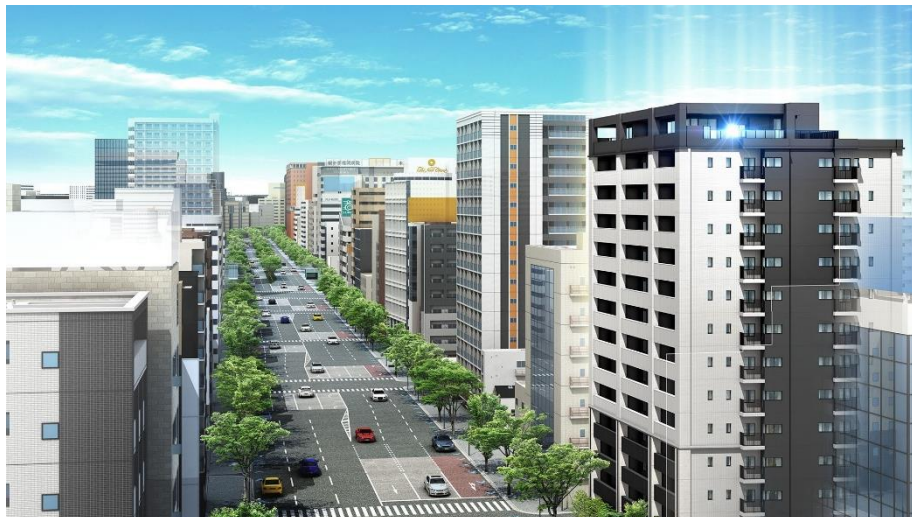
借景外観完成予想図（※4）