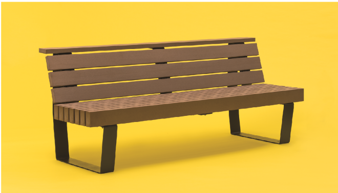
product 1 LUCY ルーシーベンチ