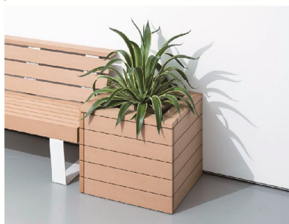
product 4 JOHN ジョンプランター