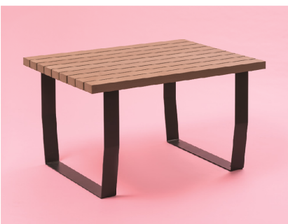
product 3 MILLA ミラテーブル