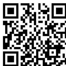
ZAB YouTube 動画

また、モリトグループ YouTube チャンネルでは、ZAB の紹介動画を配信しています。こちらもぜひ、ご覧ください。