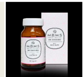
健康食品及びサプリメント