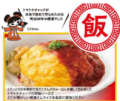
文明開化の 横浜オムライス 1050円

親子三世代で楽しめる食シーンの提供を目指し、横浜にちなんだ新メニューなどをラインナップに加えました。また、麻婆豆腐は香りに重点をおいて改良し、たんめんとの相性を向上させました。