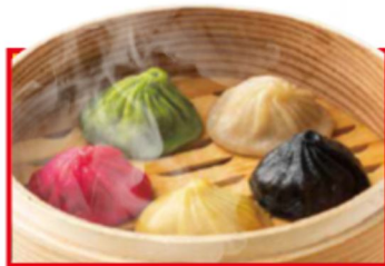
5種の彩りショーロンポー 950円

とろとろの半熟卵で具だくさんの炒飯を優しく包み、トマトケチャップの特製ソースで仕上げました。食べるとどこか懐かしさを感じる、中華オムライスです。