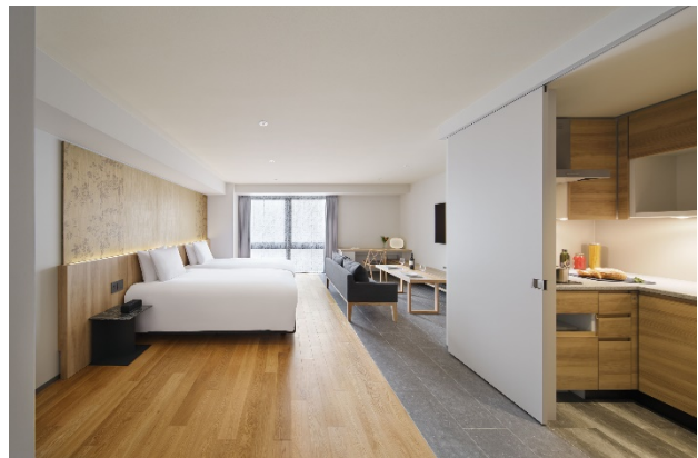
客室：スタジオデラックス