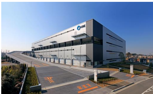
7 ロジスクエア浦和美園 2017年4月竣工