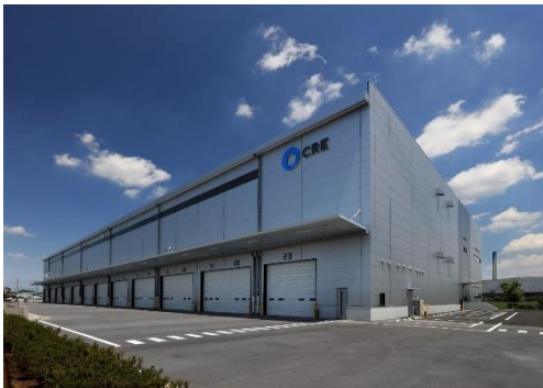
15 ロジスクエア川越Ⅱ 2019年6月竣工