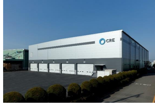
12 ロジスクエア川越 2018年2月竣工