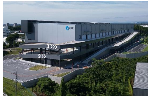
18 ロジスクエア狭山日高 2020年6月竣工