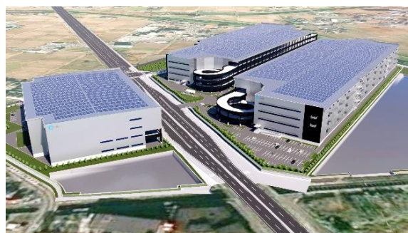
28-30 ロジスクエアふじみ野 (A棟・B棟・C棟) 2023年、2024年竣工予定