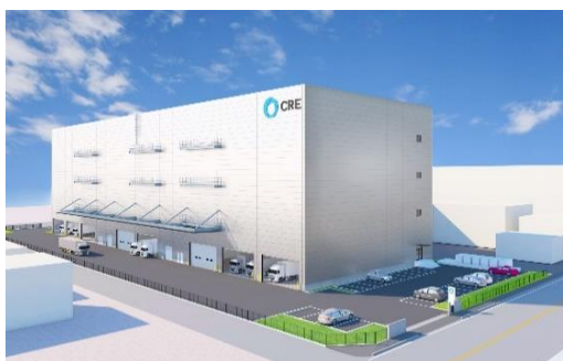
25 ロジスクエア松戸 2023年春頃竣工予定