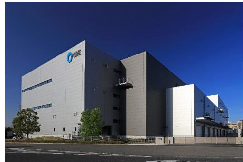
14 ロジスクエア上尾 2019年4月竣工