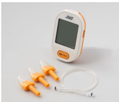
「ペコジーな」スターターキット

当社は、広島県の産官学連携プロジェクト（医療・福祉課題解決に向けたデバイス開発パイロット事業）を通じ、国立大学法人広島大学並びに県内関連企業の皆さまとともに、介護領域や家庭などで手軽に舌圧のトレーニングができるデバイス「ペコジーな」を新たに開発いたしました。楽しくトレーニングを継続できるようアプリと連動させゲームを行うことも可能です。また、既に多くのおお客様にご愛用いただいている舌圧トレーニング用具「ペコぱんだ」においても、今秋新たな硬さ「ペコぱんだ MH」の規格追加を予定しております。