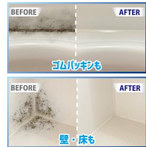
※イメージ 効果を保証するものではありません

また、カビやヌメリはもちろん、髪の毛によるパイプつまりも一発解消。かけてシャワーで流すだけでカビ菌や悪臭を元から分解します。強力なのに自然に優しく、使用後は「水・塩・酸素」に自然分解されます。今までのカビ取り剤では満足できなかった方にオススメの「カビ取り剤最終兵器 ※5」です。