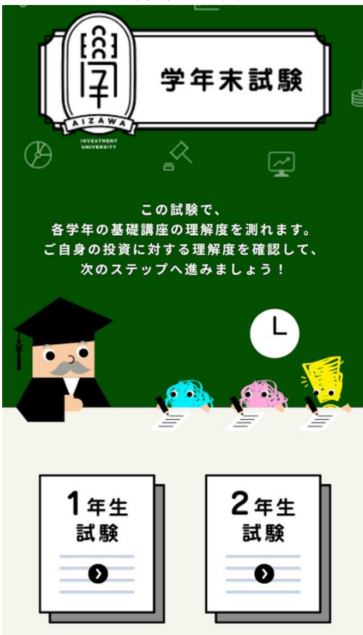
画面イメージ (学年末試験)