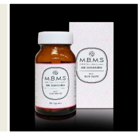
健康食品及びサプリメント