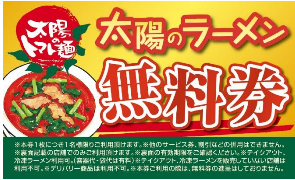
太陽のラーメン無料券