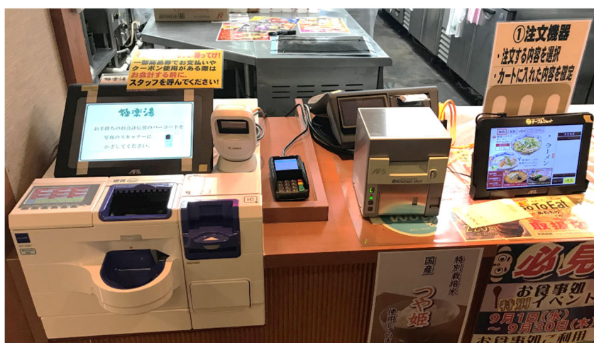
左：セルフレジシステム設置の様子