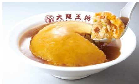
ふわとろ天津炒飯