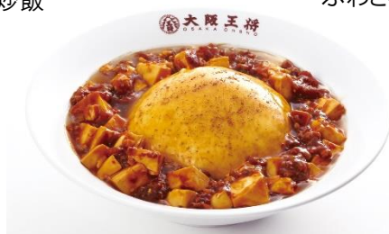
ふわとろ麻婆天津飯