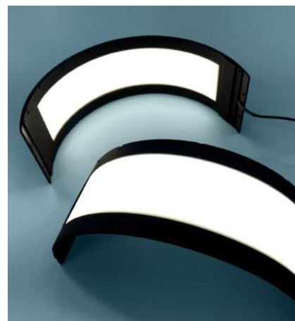
上 内側発光タイプ

OLEDは、発光部材がほぼガラス基板の厚みだけとなるため、非常に薄く、その結果重量も軽くすることができ、これにより検査装置内で照明スペースの削減が可能となります。「OLB-LT シリーズ」は黒色の筐体部分と合わせても、厚さはわずか3mmです。