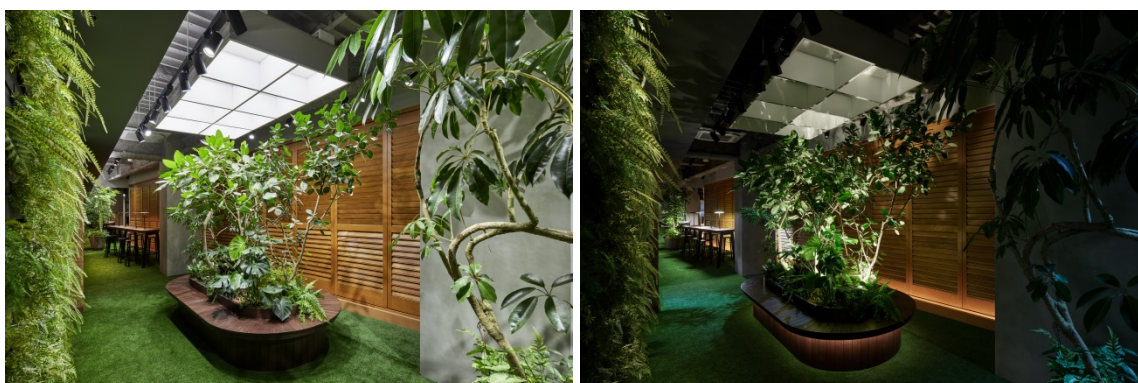
アウトドアリラックスゾーン 左：朝のシーン / 右：夜のシーン

さまざまなオフィス環境の要素に、エビデンスに基づく照明デザイン、そして新しい光の“体験（User Experience）”を統合。ここで実際に働く社員による実験を重ねながら、光を基軸とする“新しいワークプレイス”づくりを追求、発信してまいります。